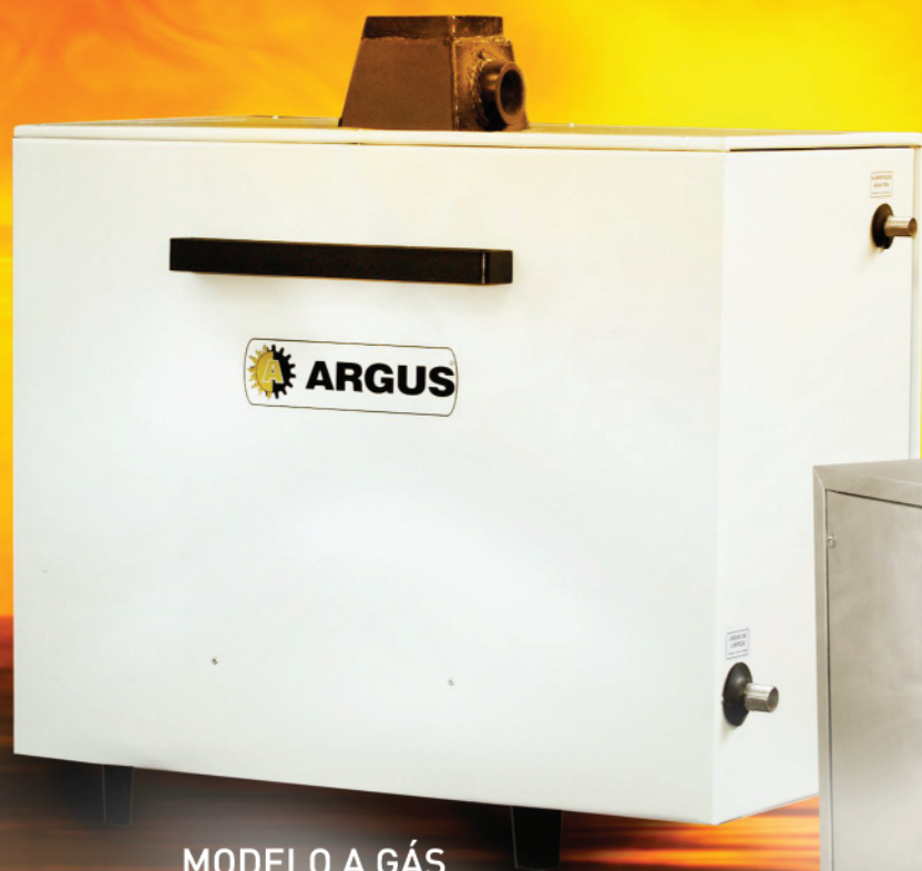
MODELO A GÁS